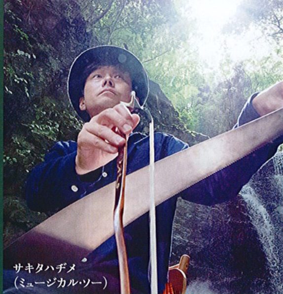
サキタハチメ (ミュージカルツアー)